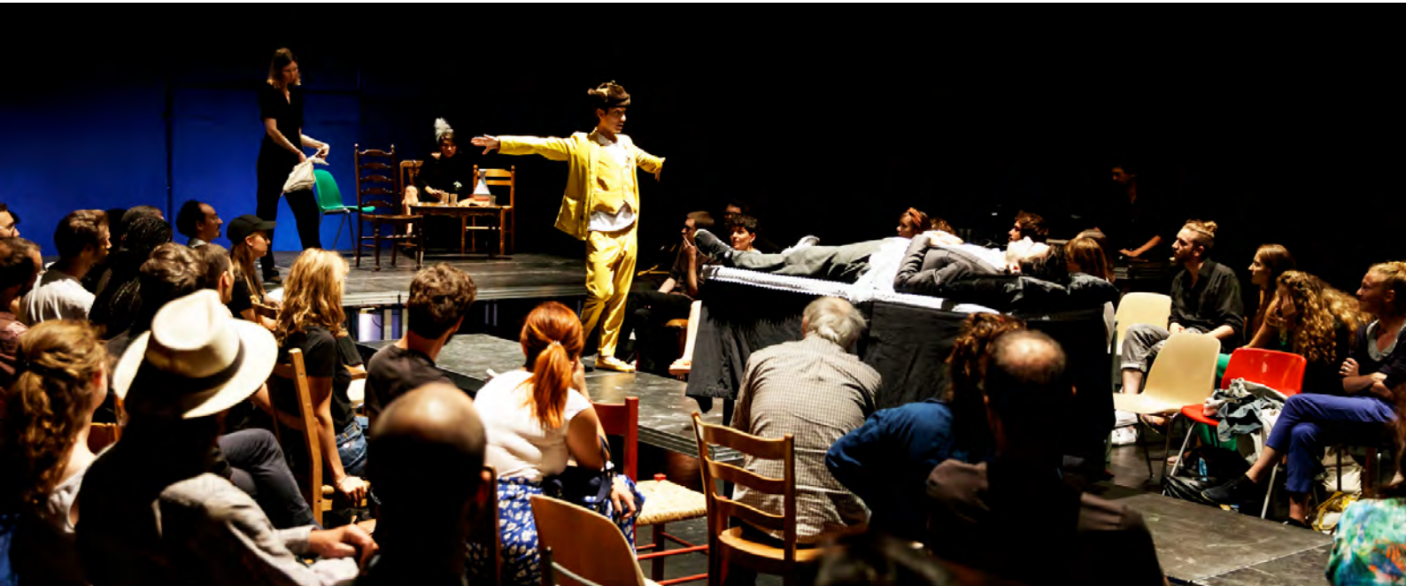
Spectacle Mystères à la Manufacture de Lausanne, septembre 2019

Tournée d'un spectacle itinérant du 3 au 24 juillet 2021 en Romandie 10 dates dans 10 lieux différents, prix libre et conscient, durée 1h15