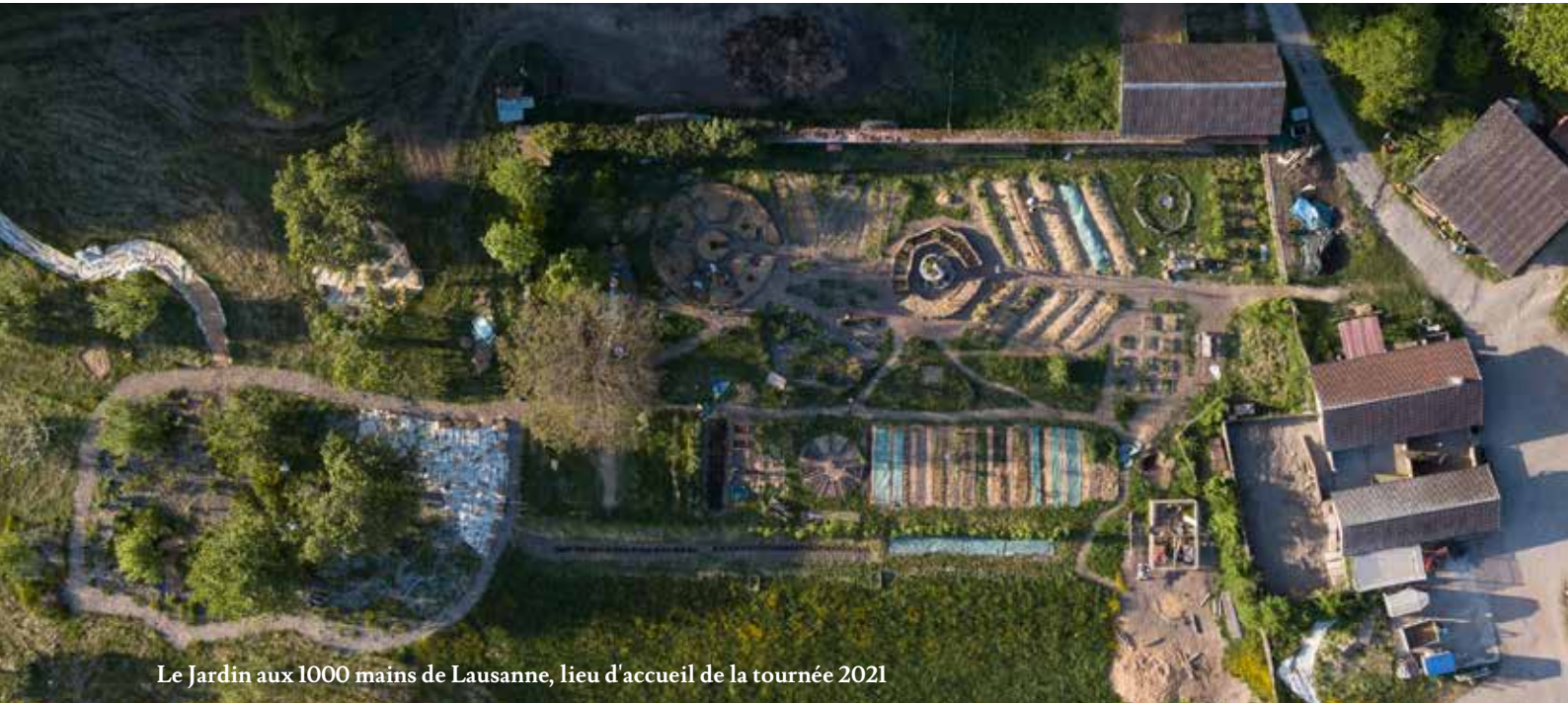
Le Jardin aux 1000 mains de Lausanne, lieu d'accueil de la tournée 2021